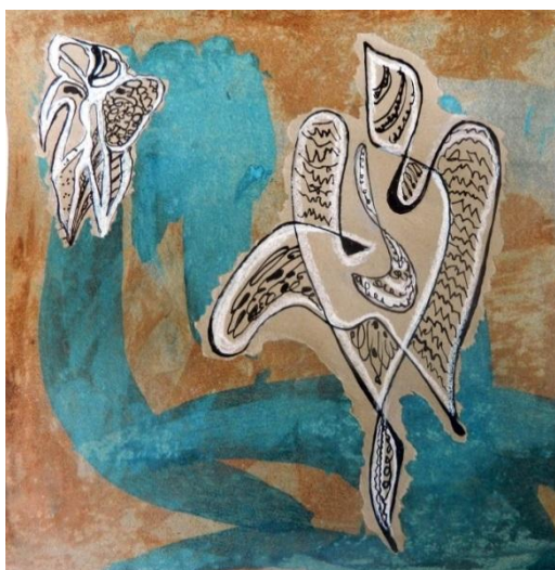
Créations d'élèves ci-dessus

L'aventure commence dans le jeu, la joie et la fantaisie. L'atelier est un lieu privilégié où chaque personne est invitée à oser créer librement, à son rythme et sans évaluation.